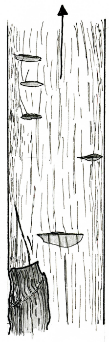
TECKNING AV DE FEM SKÄRORNA I STÄNGENS NEDRE DEL SKALA 1:1